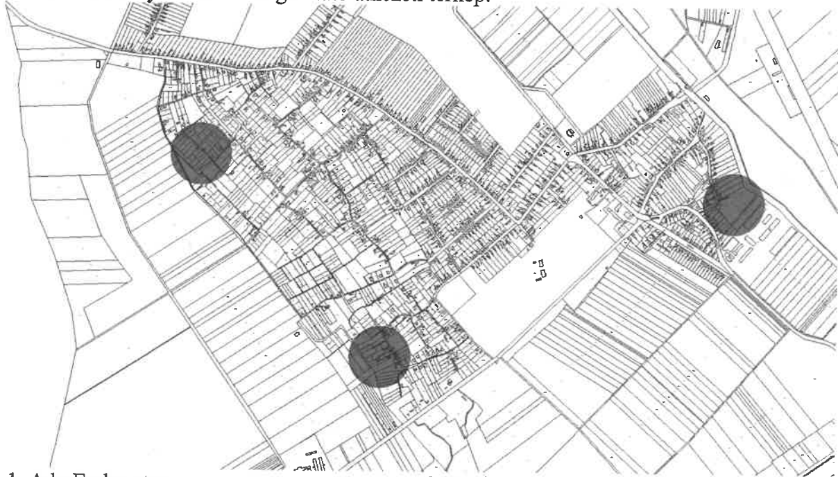
1. Ady Endre utca:

a területek elhelyezkedését megmutató átnézeti térkép: